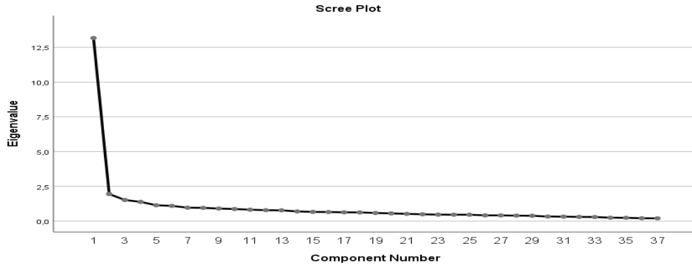
Şekil 4. 2. AFA Sonucu Yığılma Grafiği (Scree Plot)