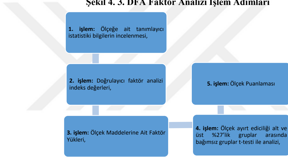
Şekil 4. 3. DFA Faktör Analizi İşlem Adımları