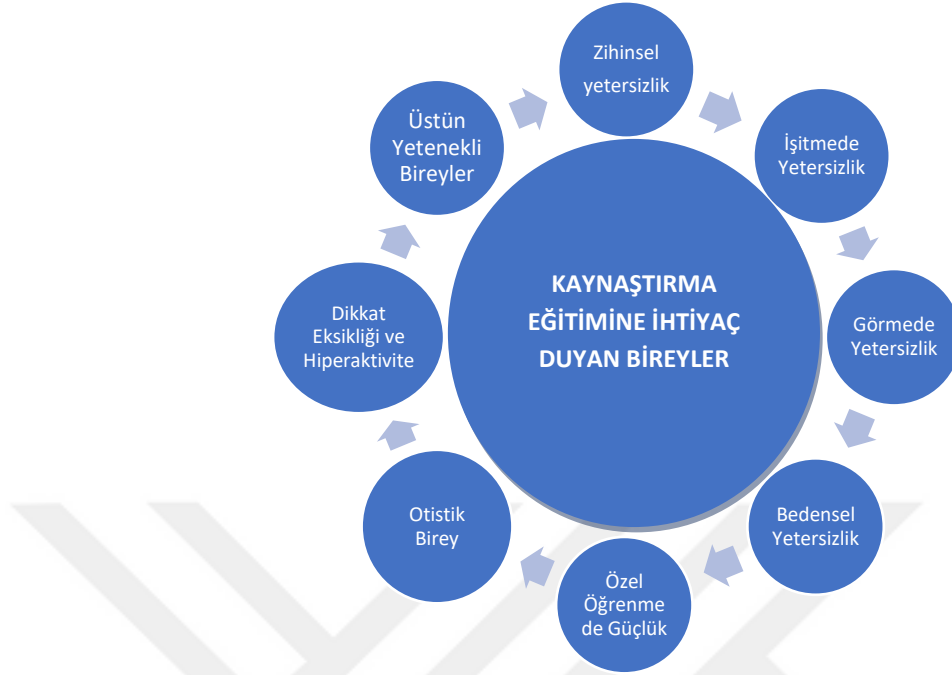
Şekil 3.1. Kaynaştırma Eğitimine İhtiyaç Duyan Bireyler Listesi