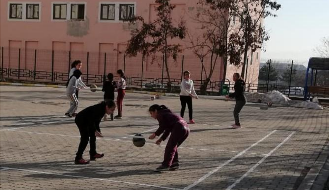
EK 3: Eğitsel Oyunlar Uygulama Resimleri