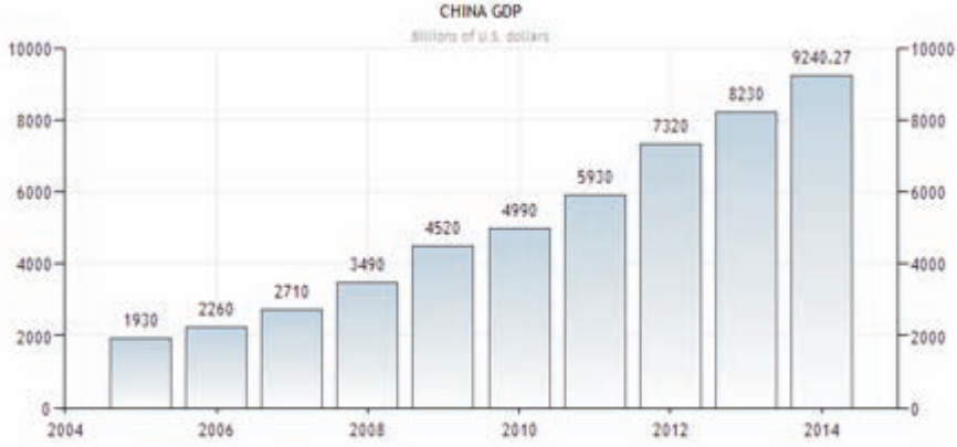
Şekil 1: 2004-2014 yılları GSMH Düzeyi

Kaynak: TradingEconomics (2015), Dünya Bankası (2015)