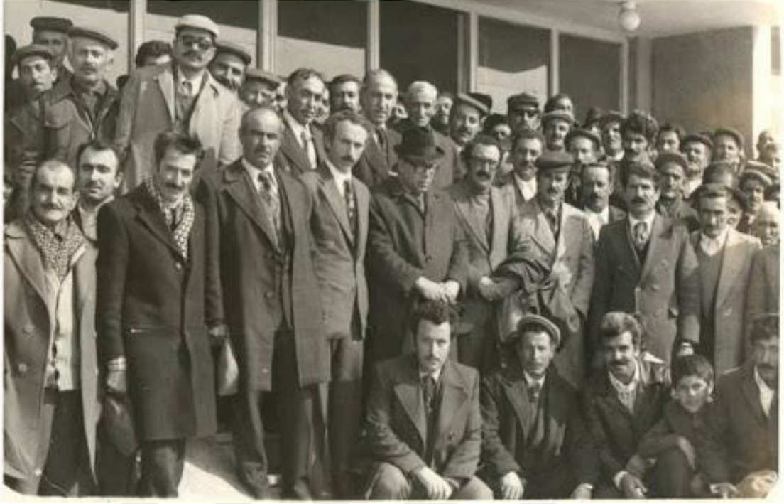
Ek 5: Hakkâri'nin Önde Gelen Simaları 1970'lerin Sonu

( https://images.app.goo.gl/5oHb5pVAQRjzYVRw7 04.09.2021).