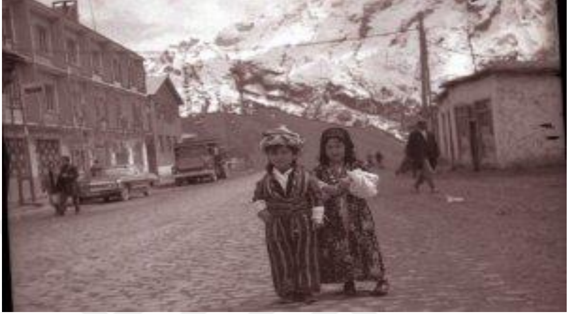
Ek 3: 1970'li Yıllarda Hakkâri'de Yaşam

( https://images.app.goo.gl/GtHZJuUmJPnrS1Lw7 04.09.2021).