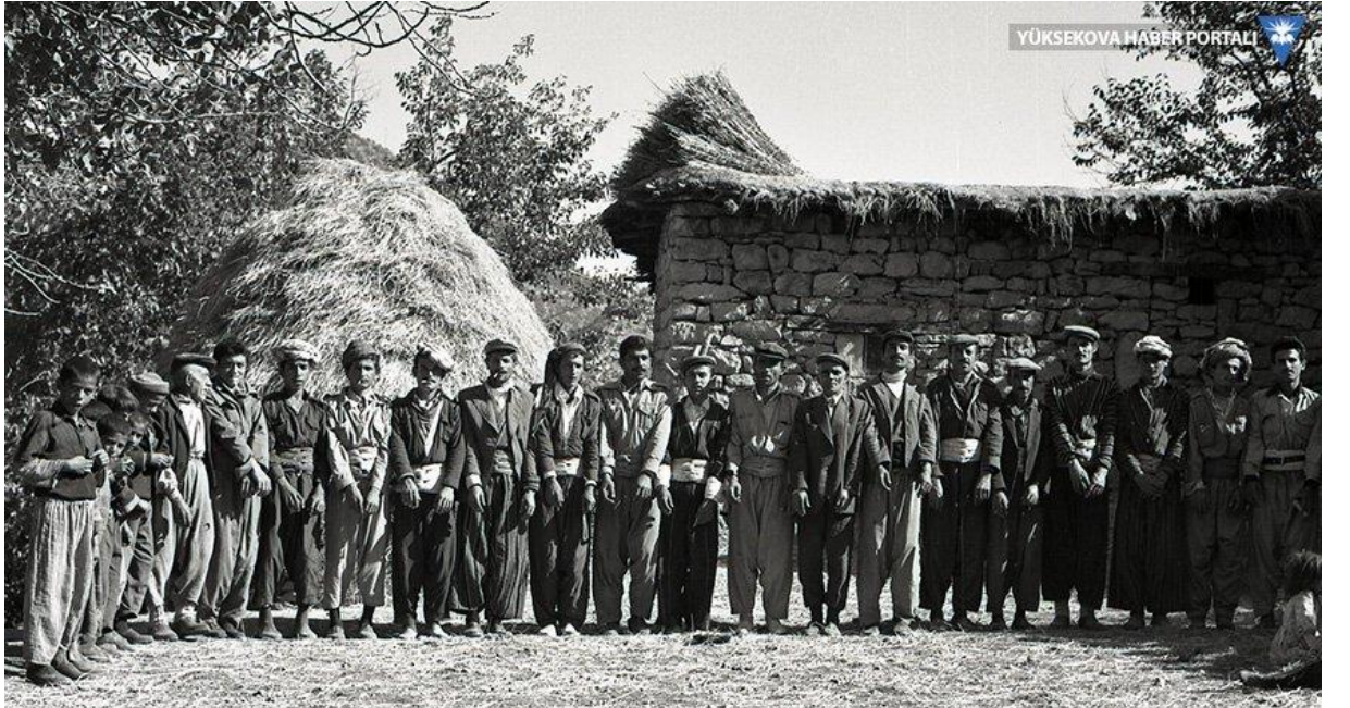
Ek 4: 1970'li Yıllarda Çukurca Köylüleri

( https://images.app.goo.gl/UhcmPc9e2WrbBUdD8 04.09.2021).