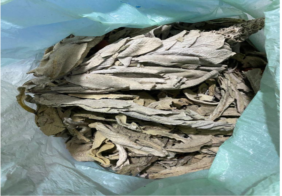
Fotoğraf-21: Hekimin kaynatıp içine oturması için hastaya verdiği şifalı ot karışımı