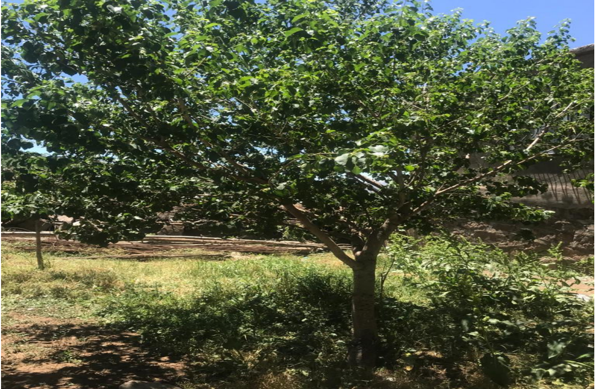
Fotođraf-23: Nazar deđmemesi iin evlerin nne dikilen kenir ađacı