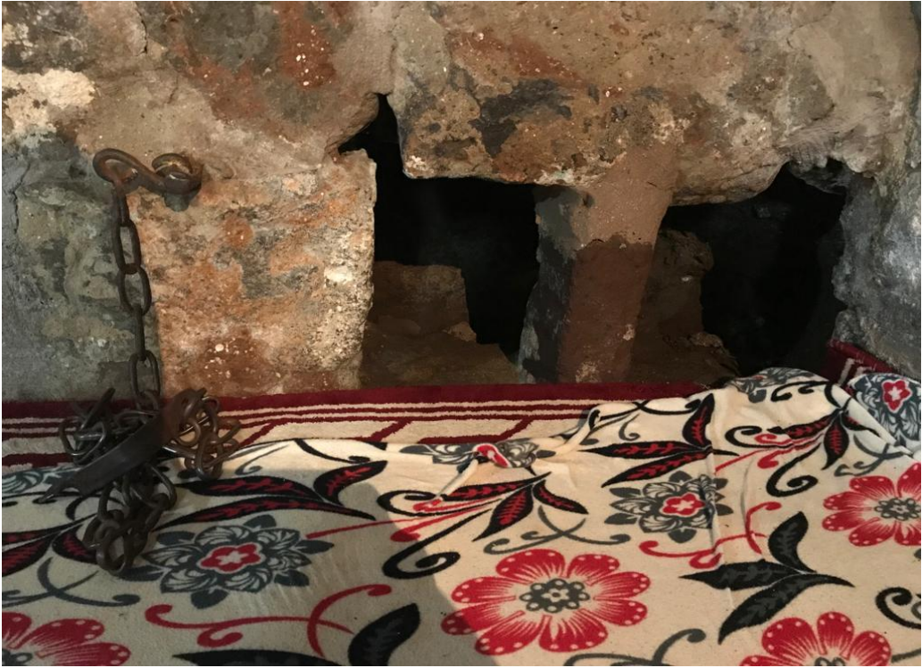
Fotoğraf-17: Şeyh Garip Türbesi'nde bulunan zincir ve delik Bitlis/Merkez