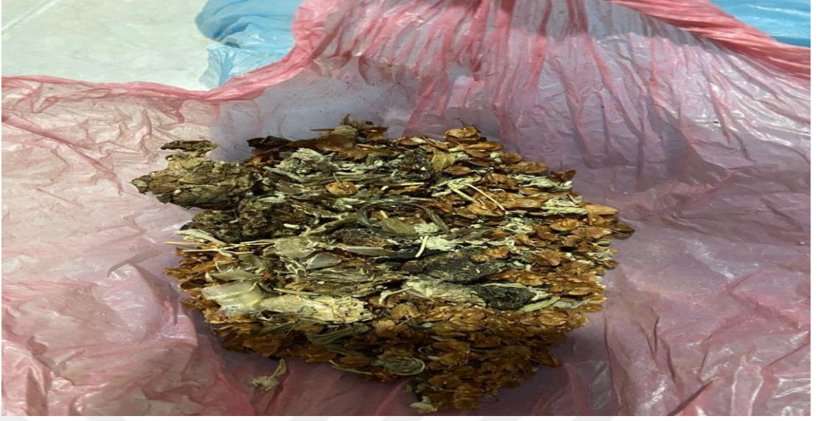
Fotoğraf-20: Hekimin içmesi için hastaya verdiği şifalı ot karışımı