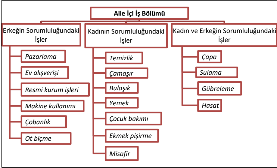
Şekil 4. Aile içi iş bölümü