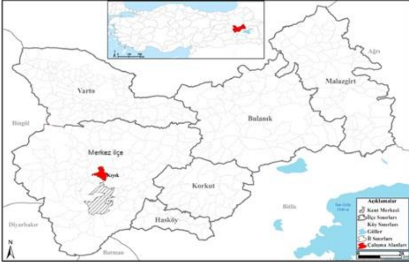
Şekil 1. Çalışma sahasının lokasyon haritası

Muş şehri, etrafı dağlarla çevrili olan Muş Ovası üzerinde konumlanmıştır. Bu ova, Muş'un stratejik bir coğrafi konumda yer almasını sağlar. Muş Ovası'nın doğusunda Nemrut Dağı yer almaktadır. Nemrut Dağı, aynı zamanda Türkiye'nin en büyük volkanik krater göllerine sahip olup hem doğal güzellikleri hem de turistik potansiyeli ile dikkat çeker. Ovanın güneyinde Güneydoğu Toroslar, bölgenin dağlık alanlarını oluşturur ve bu dağlar, Toros Dağları'nın bir parçası olarak Muş'un iklimini ve ekosistemini etkiler. Batısında ise Bingöl Dağları yer almaktadır. Muş Ovası'nın kuzeyinde ise Şerafettin Dağları ve Akdoğan Dağları bulunur.