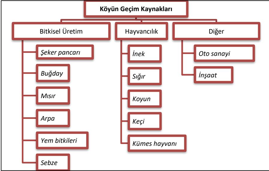
Şekil 3. Köyün geçim kaynakları

Çalışma sahasında çalışma çağındaki insanlar, şehirlere göç ederek başta inşaat olmak üzere diğer hizmet sektörlerinde çalışmaktadır. Bu tür işlerin daha çok erkek işi olarak kabul edilmesi ve erkeklerin hareket kabiliyet ve özgürlüklerinin fazla olması bu tablonun oluşmasında etkili olmuştur. Durum böyle olunca kırsalda kadınlara daha fazla iş yükü kalmaktadır.