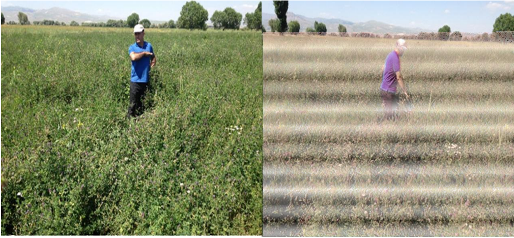
Şekil 3.3. Yonca bitkisinin boyunun ölçülmesi

Bitki boyu, her parselde 10 bitkinin bir tekrerrü olduğu rastgele seçilen 15 bitkinin en alt seviyesinden en üst seviyesine kadar olan kısmı santimetre cinsinden ölçülerek ve ortalaması alınarak elde edilmiştir (Anonim, 2001).