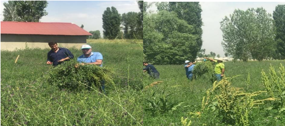
Şekil 3.4. Yeşil yonca otu veriminin belirlenmesi

Örnek alınmak üzere başına gidilen parsellere 2 adet 0,5 x 0,5 m (toplam 1 m 2 ) metal kuadrat taşınmazın dört ayrı noktasına rastgele atılmış ve çerçeve içinde kalan yonca bitkileri en dip seviyesinden biçilerek toplanan yonca bitkileri tartılmış ve dört farklı tartı ortalamaları alındıktan sonra dekara verim ortalamaları bulunmuştur.