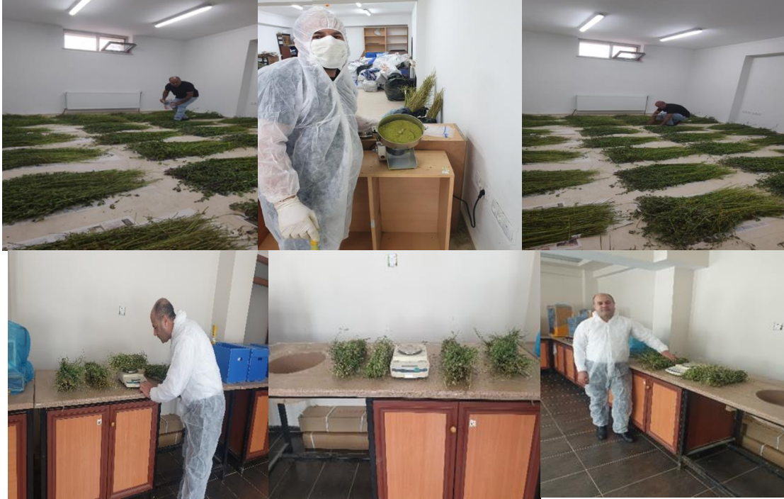
Şekil 3. 5. Yonca örneklerinin kuru ot veriminin tespit edilmesi

Örnek alınmak üzere başına gidilen parsellere 2 adet 0,5 x 0,5 m (toplam 1 m 2 ) metal kuadrat taşınmazın dört ayrı noktasına rastgele atılmış ve çerçeve içinde kalan yonca bitkileri en dip seviyesinden biçilerek toplanan yonca bitkileri tartılmış ve dört farklı tartı ortalamaları alınarak biçilen otlar karıştırıldıktan sonra 1 kg'lık örnek alınarak gölgelik bir alanda 2 hafta kurutulmuş ve elde edilen kuru ot değerleri dekar verimine çevrilmiştir(Anonim, 2001).