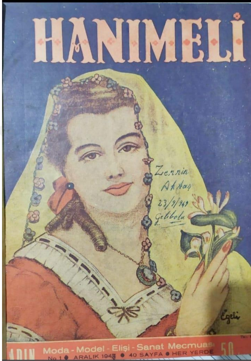
Ek 1: Hanımeli Dergisi ilk kapak fotoğrafı, Sayı 1, 1948