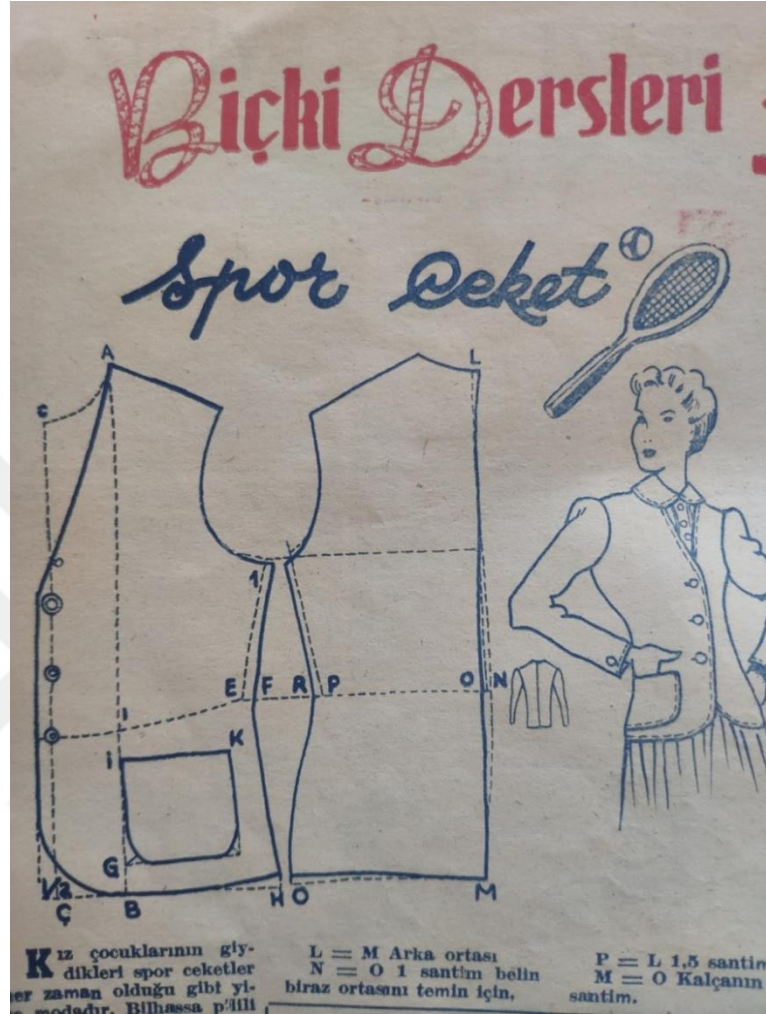
Ek 8: Hanımelinde Kadın Eğitimi; Biçki Dersleri, Hanımeli, Sayı 28, 1950