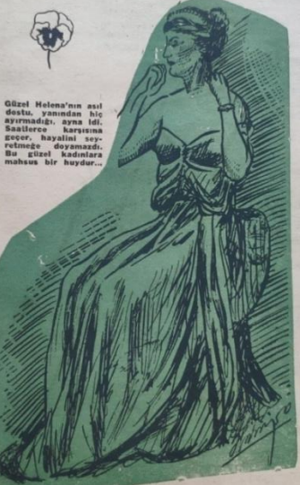
Güzel Helena'nın aklı dostu, yamandan hiç ayrılmadığı, aynı idli. Saadilece karısına sezer, hayalini sevmeye doğmazdı. Bu güzel kadınlara mâsum bir haydur...