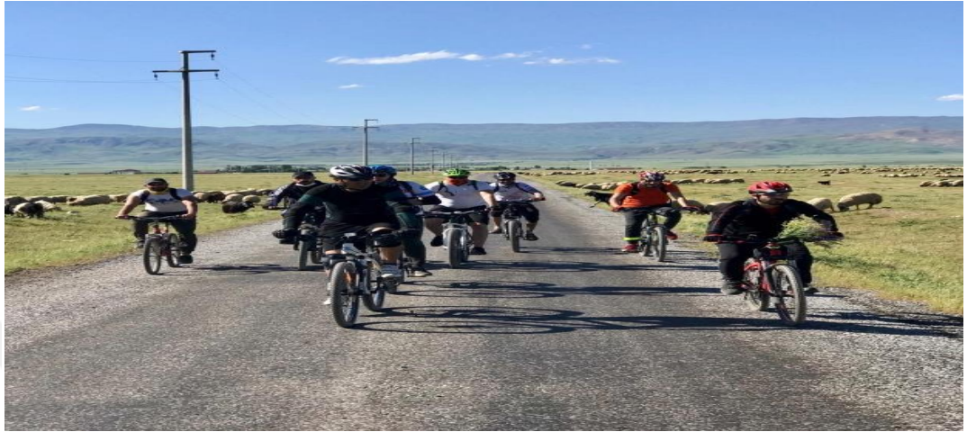
Şekil 1.3. Bisiklet Turu