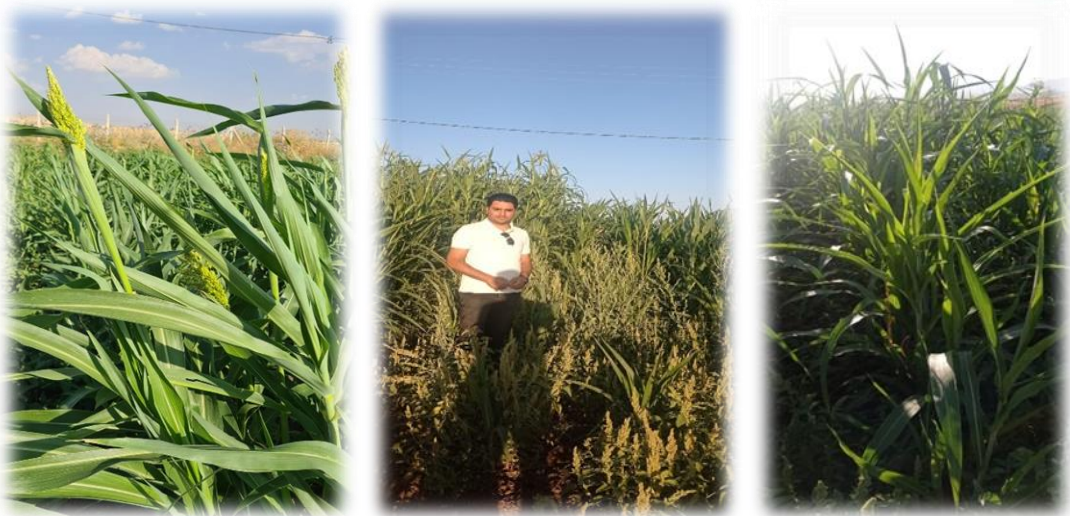
Şekil 3.5 Denemeden Bazı Görüntüler

Yabancı ot mücadelesinde bitkilerin boyu 15-20 cm yüksekliğine ulaştığında çapalama ve bitkiler 40-50 cm boyuna ulaştığında dönemde yabancı ot mücadelesi ve kök boğaz doldurma işlemleri yapıldı.