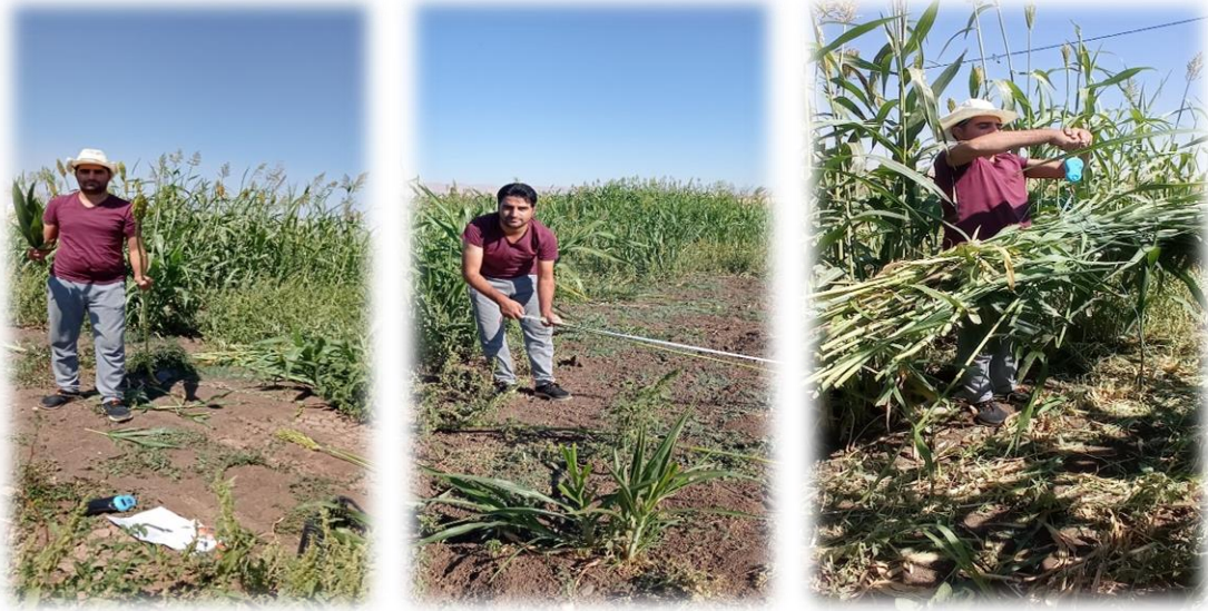
Şekil 3.8. Hasattan Bazı Görüntüler