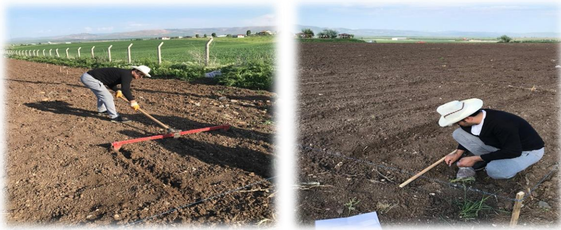
Şekil 3.3. Toprak Ekim İşlemi

Araştırmada parsellerde el markörüyle 4 sraya 70 cm sıra arasına 4-5 cm derinliğinde tohum ekimi yapılmıştır. Ekim 01.06.2022 tarihinde elle serpilerek dekara 1.5 kilogram olacak şekilde ekilmiştir. Tesadüfî Bloklar Deneme Desenine göre 3 tekrarlı yapılmış ve parsel alanı: 5\text{m} \times 2.8\text{m} = 14\text{m}^2 'dir (Fernandez ve ark., 2012).