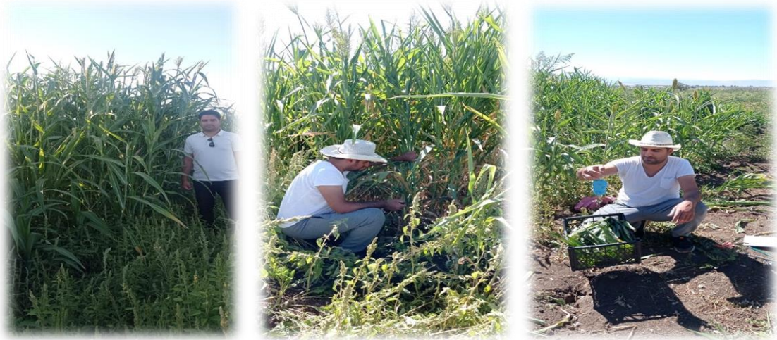
Şekil 3.7. Hasattan Bazı Görüntüler

Araştırmada sorgum çeşitleri 10-11 Eylül 2022 tarihleri arasında hamur olum döneminde hasadı yapılmıştır. Hasat zamanı, ortadaki 2 sıradan ve parsel kenarındaki 2 sıradan 30 cm kenar tesiri olarak denemenin dışına bırakıldı. Hasadı yapılan sorgum bitkileri tartılıp yaş ağırlığı kaydedilmiş olup bitkilerden her parselin orta 2 sırasında tesadüf olarak alınan 10 tane sorgum bitkisi gözlem ve ölçüm için ayrılmıştır.