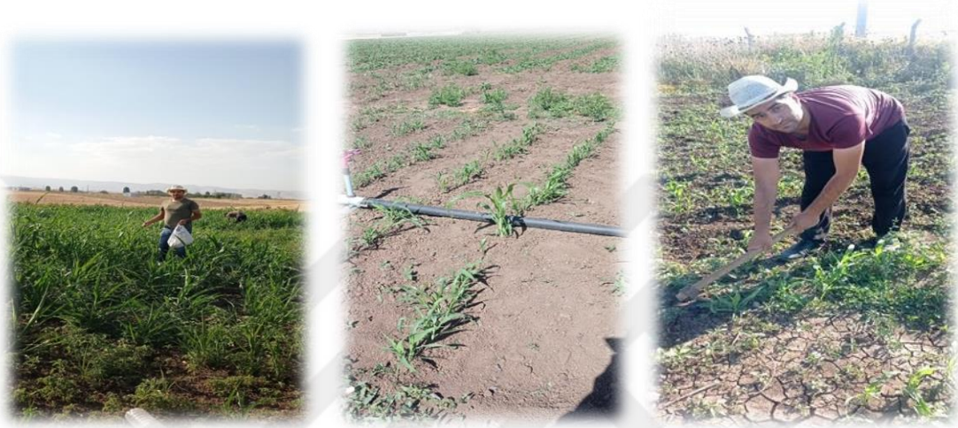
Şekil 3.4. Gübreleme ve Çapalama

Sorgum taneleri küçük olduğundan ekim elle yapıldıktan sonra istenilen bitki sıklığını için seyreltme ve tekleme işlemi yapıldı. Denemede dekara 14 kg azot (N) (% 33 Amonyum Nitrat) uygulanacaktır. Azot' un yarısı (7.0 kg/da) ekim ile kalan yarısı ise (7.0 kg/da) bitkilerin 40-50 cm ulaştığı dönemde verildi. Ayrıca 8kg/da P 2 O 5 (Triple Süper Fosfat) gübresi verilmiştir(Avcı ve ark., 2018).