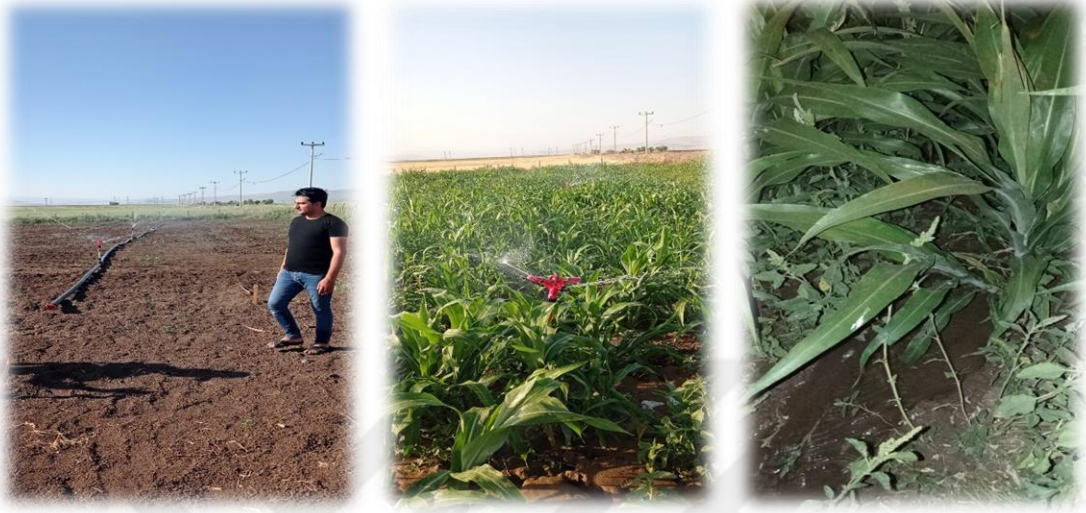
Şekil 3.6. Sulama Alanından Görüntüler

Bitkinin verimliliğinin artması için sulama önemlidir. Bunun için bitki 100-120 cm arasında yağmurlama sonrasında salma yöntemi ile deneme sulandı.