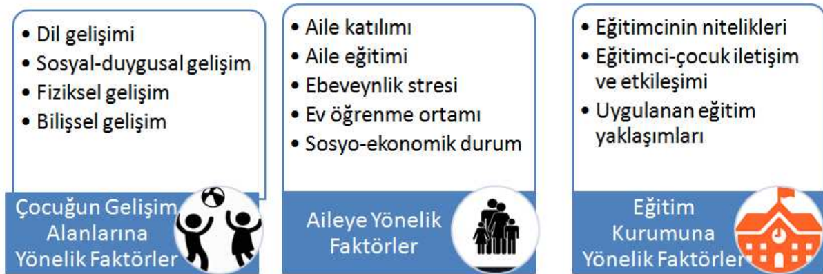
Şekil 1. Okul hazır bulunuşluğu ile ilgili faktörler

Bu bölümde çocuğun okul hazır bulunuşluğuyla ilişkili olan ve onu etkileyen aile, eğitim kurumu-öğretmen ve çocuğa yönelik faktörler ve bu faktörleri oluşturan içerikler incelenmiştir. Bu içerikler görsel olarak aşağıda sunulmuştur (Şekil 1).