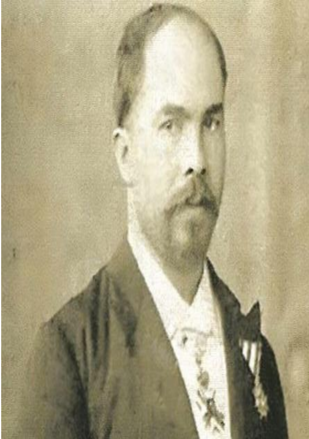
Ek-18. Bulgaristan Bařbakanı: Stefan Stambolov