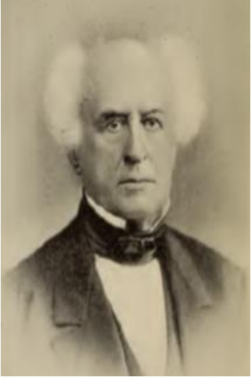
Robert Koleji Hatıraları İstanbul'da Elli Yıl