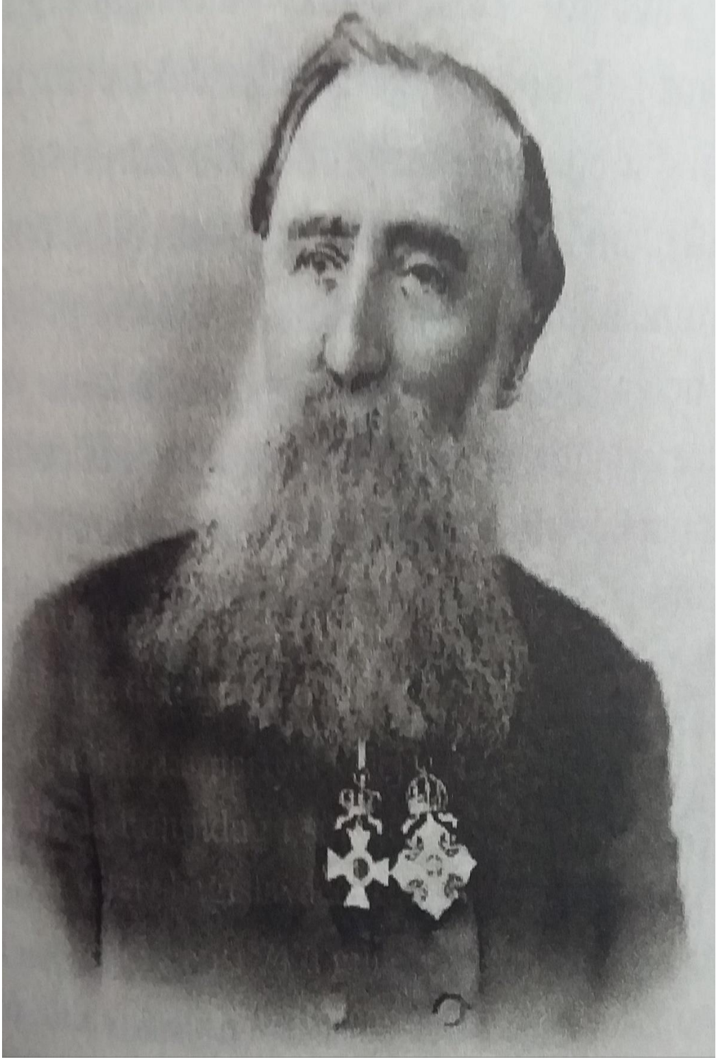
Robert Koleji Hatıraları İstanbul'da Elli Yıl Sayfa. 187