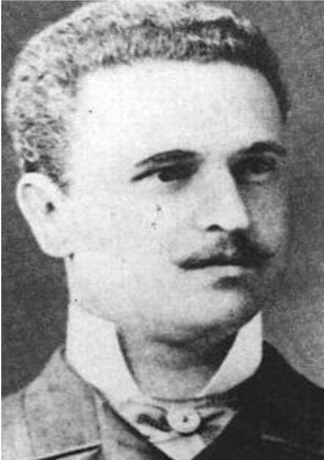
Ek-17. Bulgaristan Bařbakanı Konstantin Stoilov

https://en.wikipedia.org/w/index.php?title=Konstantin_Stoilov&oldid=947546621