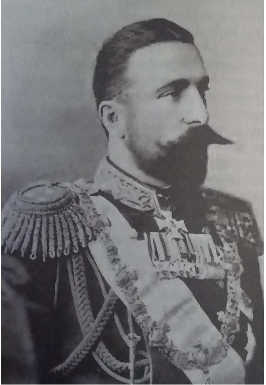
Robert Koleji Hatıraları İstanbul'da Elli Yıl, Sayfa. 212