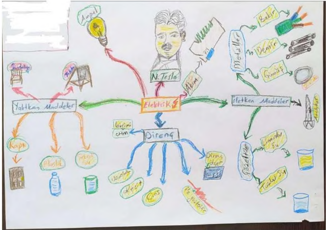
Şekil 5. Sınıf öğretmeni adaylarının zihin haritalarından örnekler