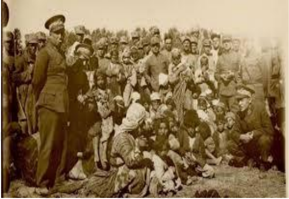
EK - 11. Mustafa Kemal Atatürk'ün I. Umumi Müfettiş Abidin Özmen 'İ Diyarbakır 'da Ziyareti 301