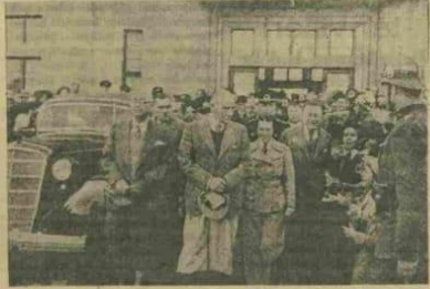
Atatürkün Svasta karpişmalarına aldır intiba