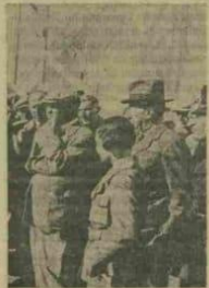
Atatürkün Svasta tedkiklerine aldır intiba

Mükâbbelen tayyare alayı kışkırtı tarafından selâmlanan Atatürk, tayyarecilerinin dininden yürüyerek geçmişler ve illüta bulmuşlardır. Mükâbbelen tayyare alayı kışkırtı tarafından selâmlanan Atatürk, tayyarecilerinin dininden yürüyerek geçmişler ve illüta bulmuşlardır.