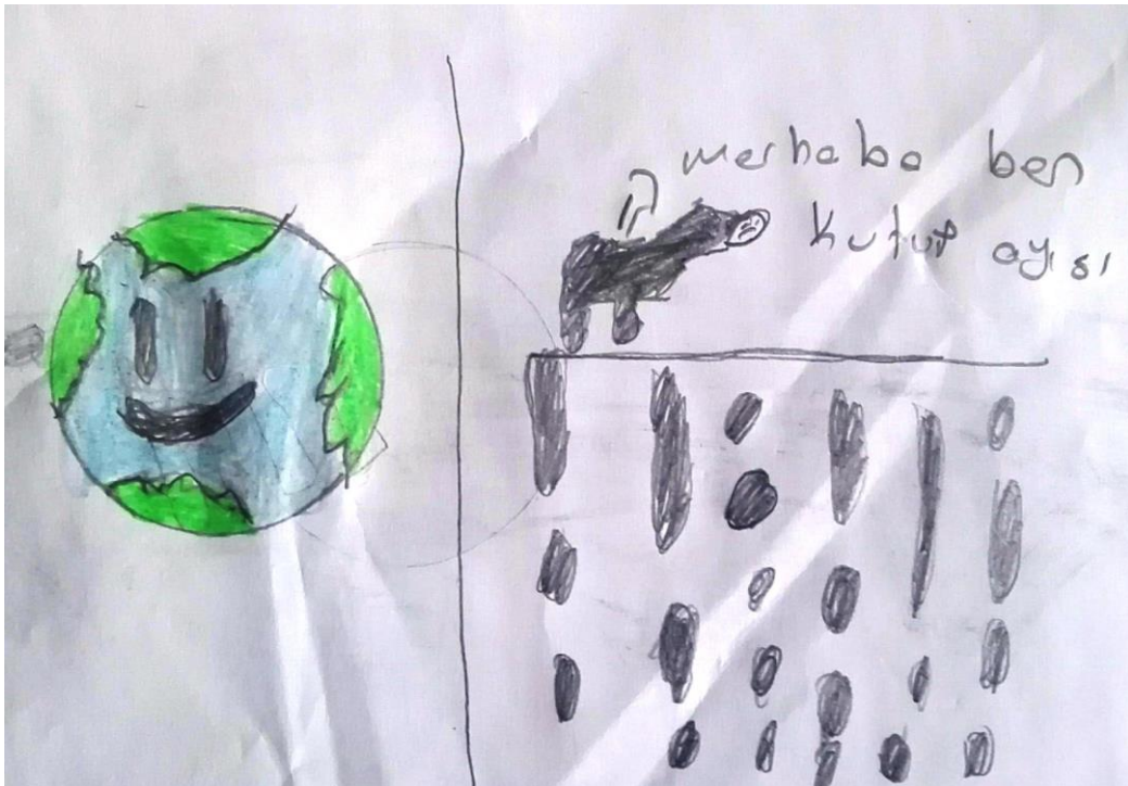
Çizim 2. Muş ilindeki bir katılımcının örnek çizimi(K35)