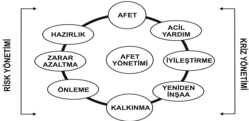
Şekil 1.1. Afet Yönetimi Aşamaları (www.afad.gov.tr/kitaplar).

Afet ile ilgili yapılan tanımlamalardan sonra afetin çeşitleri ve etkileri hakkında kısaca bilgilere yer verilmiştir. T.C. Başbakanlık Afet ve Acil Durum Yönetimi Başkanlığı bünyesinde hazırlanan ‘Teoride ve pratikte afet sonrası iyileştirme çalışmaları’ adlı kitapta afet yönetimi yapılmıştır. Bu tanıma göre afet yönetimi, insanların yaşadıkları çevrede meydana gelen doğal olaylardan haberdar olmaları, bunları nedenlerine kadar ayrıntısı ile tanımaları ve bu olayların tekrarı durumunda bunlardan hiç etkilenmeme veya en az oranda etkilenmelerine olanak tanıyan çalışmaların tümü şeklinde tanımlanmıştır.