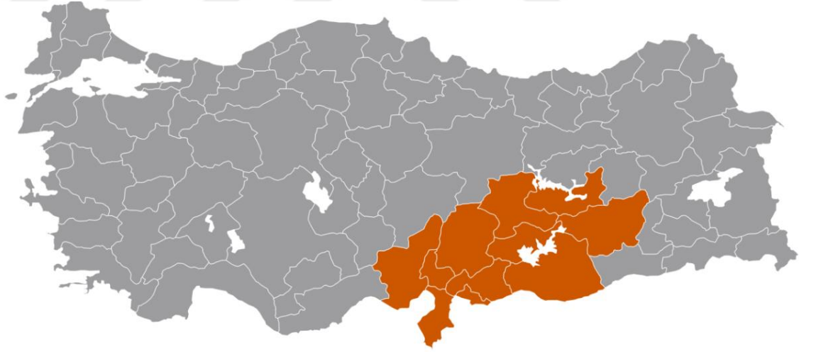
Şekil 1.3. 06.02.2023 Depremlerinin Etkili Olduğu Coğrafya (deprem.afad.gov.tr).