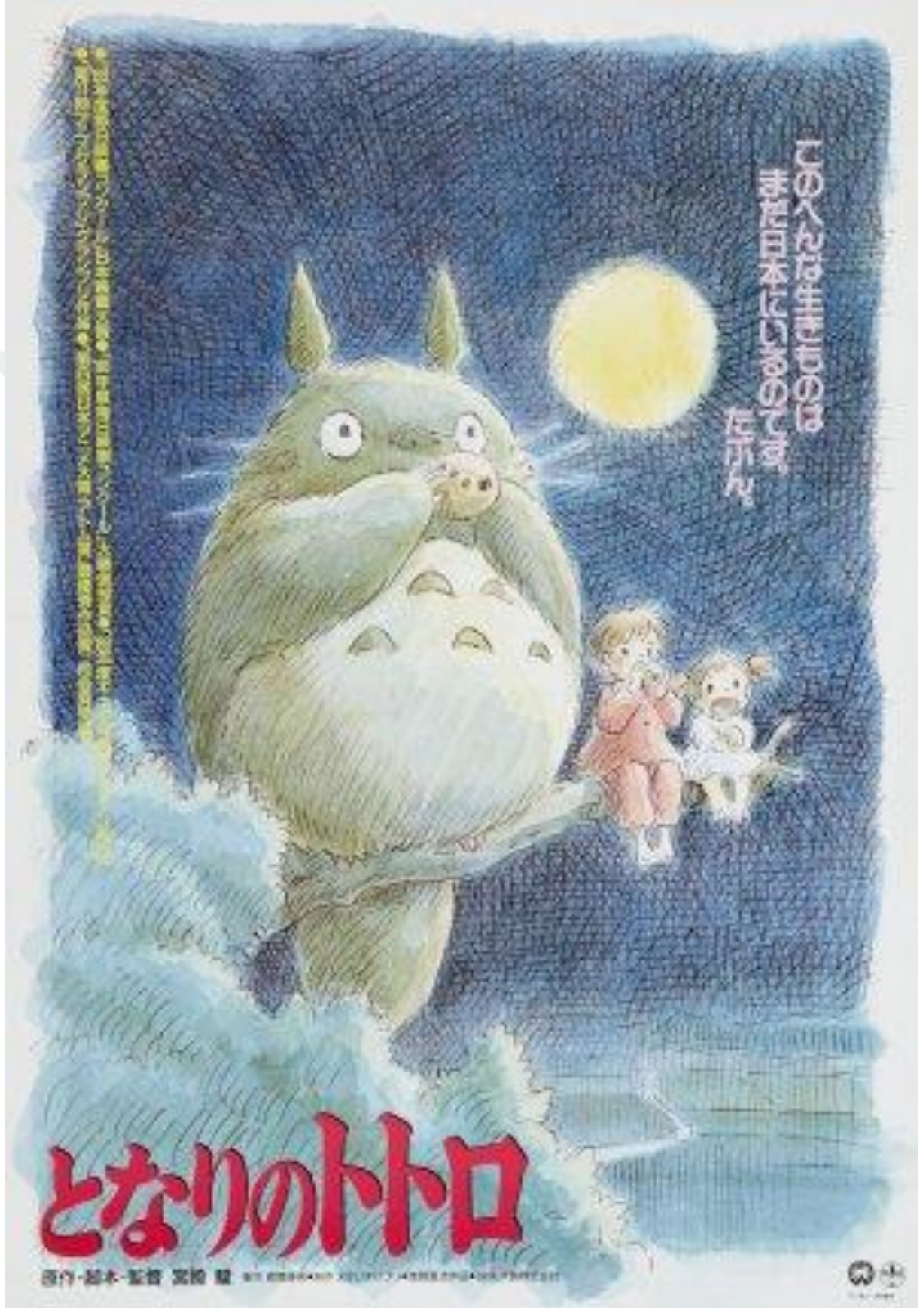
Şekil 1. Komşum Totoro Film Afışı