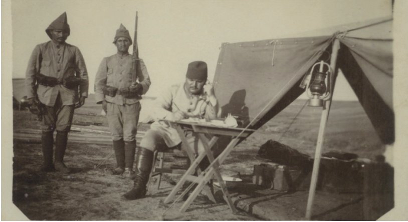
Birinci Dünya Savaşı'nda cephede telefon kullanan Osmanlı subayı

Telefon hatları, başkent İstanbul'da çeşitli gerekçelerle fakat en başta bürokratik yazışmaların hızlandırılması maksadıyla kurulmak istenmişti. Rumeli ve Anadolu'da ise, neredeyse tamamen asayişin sağlanması maksadıyla karakollara kurulması talep edilmiştir. Bu hususta vilayetlerden sıkça talepler gelmiştir. Ancak bütçenin mevcut durumu bu taleplerin ya geç karşılanmasına ya da reddedilmesine sebep olmuştur. Talep yapan yerler arasında Rumeli'de Selanik, Kosova ve Manastır; 108 İran hududunda Bitlis, Van ve Hakkâri kentleri başı çekmekteydi. 109 İran hududundaki vilayetlerden giden taleplerde özellikle eşkıyalık faaliyetleri öne sürülmüştür. Hatta yerel idareciler eşkıyanın cezalandırılması için yeni karakolların kurulmasıyla buralara bağlanması gereken telefon mevzusunu farz-ı ayn hükmünde sayılacak derecede mühim bir mesele şeklinde aksettirmiştir. 110