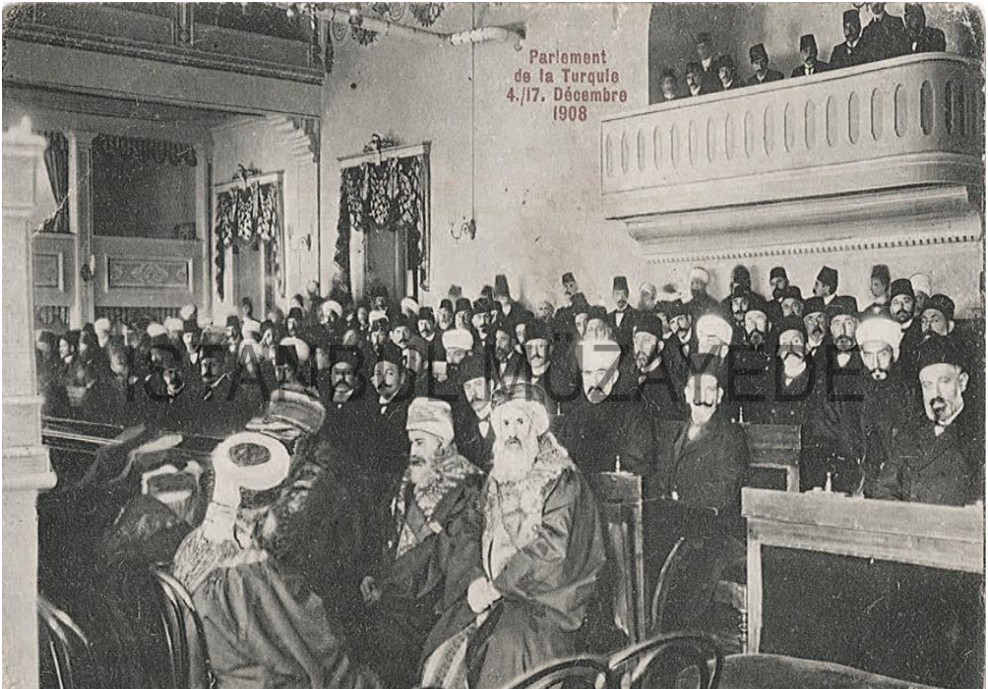
Ek-2: II. Meşrutiyet Parlamentosu ( http://devlet.com.tr/makaleler , Erişim Tarihi: 26.05.2020)